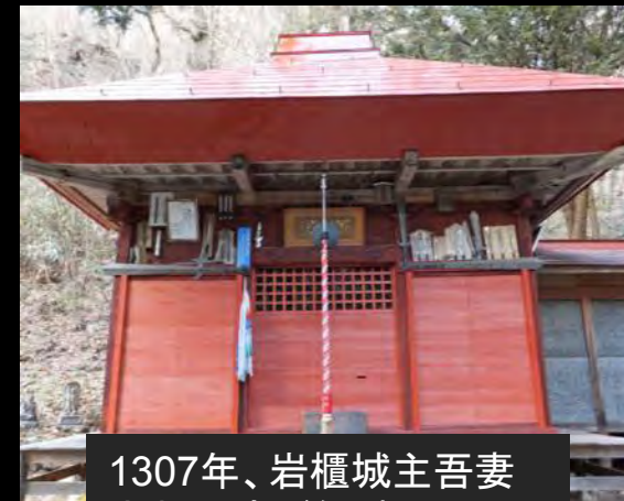
1307年、岩櫃城主吾妻 太郎行盛が勧請した、 観音山(龍峨山)不動尊